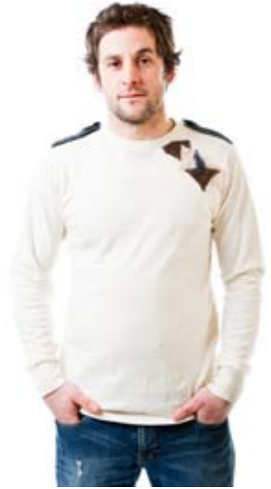
#360 SHOLDER L/S top Heavy jersey 9 oz 55% hemp, 45% organic cotton S-M-L-XL