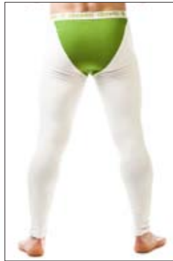
#470 FOX HEMP long johns Stretch jersey 8 oz 53% hemp, 43% organic cotton, 4% spandex S-M-L-XL