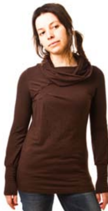
#157 JAIPUR top Stretch jersey 8 oz 70% viscose bamboo, 25% cotton, 5% spandex XS-S-M-L-XL