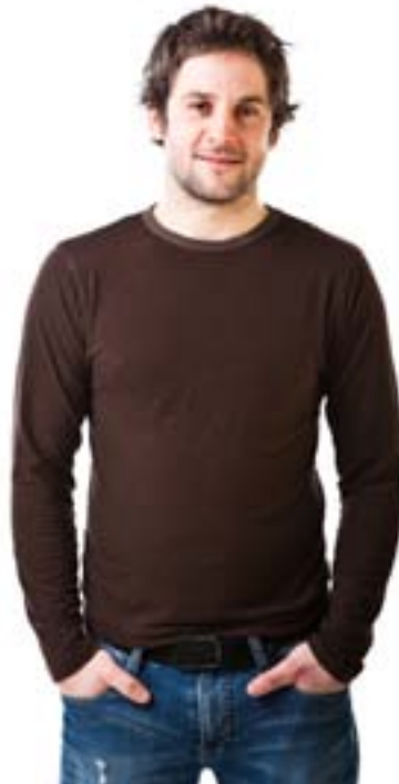
#395 EVERYDAY L/S tee Stretch jersey 8 oz 67% viscose bamboo, 28% cotton, 5% lycra S-M-L-XL-XXL