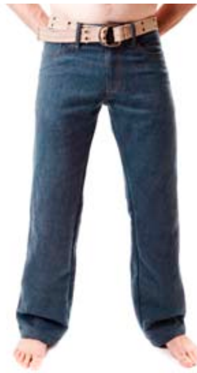
#425 JIMMY jeans HempPoly jeans 9 oz 77% hemp, 23% recycled polyester 30-32-34-36-38