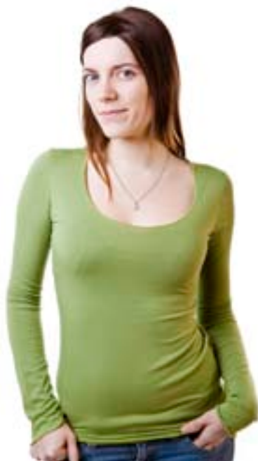
#159 JULIETTE L/S top Stretch jersey 8 oz 67% viscose bamboo, 28% cotton, 5% lycra XS-S-M-L-XL