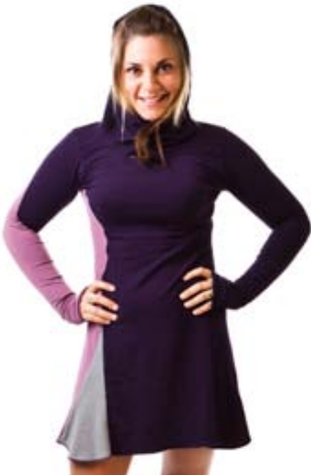
#124 HILALAI hoodie dress Stretch jersey 8 oz 70% viscose bamboo, 25% organic cotton, 5% spandex XS-S-M-L-XL