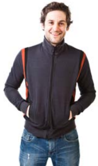
#309 REAL fleece jacket Stretch fleece 11 oz 70% viscose bamboo, 25% organic cotton, 5% spandex XS-S-M-L-XL