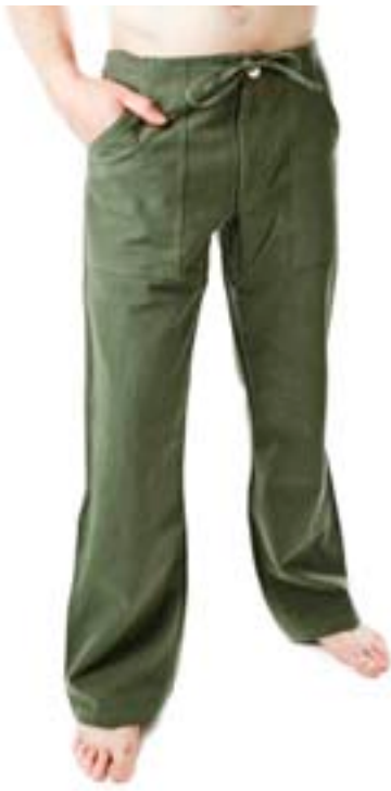
#420 KAMELEON pants Hemp muslin 7,4 oz 55% hemp, 45% organic cotton, XXS-S-M-L-XL-XXL