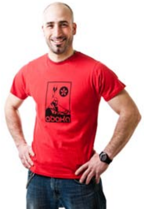
#AM1 SMOKY INDIAN print tee Medium jersey 7 oz 55% hemp, 45% organic cotton S-M-L-XL-XXL