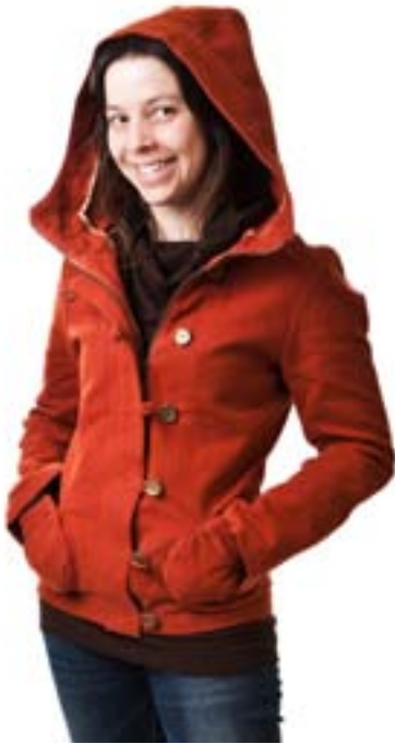
#105 GRENOUILLE jacket Hemp canvas 14 oz 55% hemp, 45% organic cotton S-M-L-XL