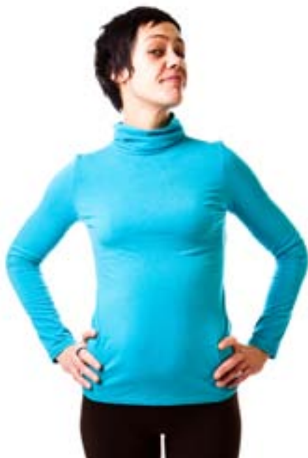
#158 TORTUE top Stretch jersey 8 oz 67% viscose bamboo, 28% cotton, 5% lycra XS-S-M-L-XL