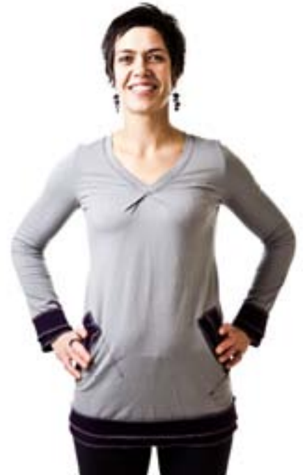
#123 DAO top Stretch jersey 8 oz 70% viscose bamboo, 25% organic cotton, 5% spandex XS-S-M-L-XL