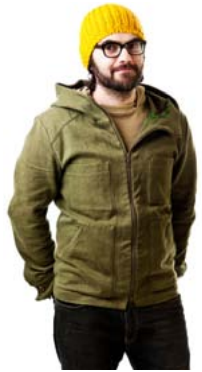
#305 CRAPAUD canvas jacket Hemp canvas 14 oz 55% hemp, 45% organic cotton S-M-L-XL