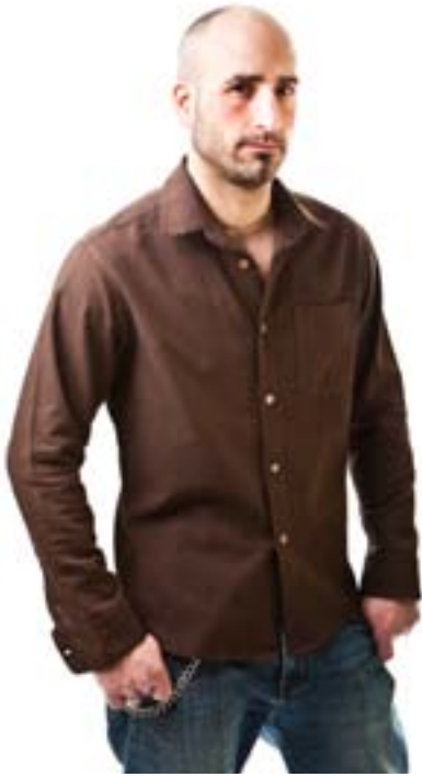
#320 VICTOR L/S shirt coconut buttons Hemp muslin 3,6 oz 55% hemp, 45% organic cotton S-M-L-XL-XXL