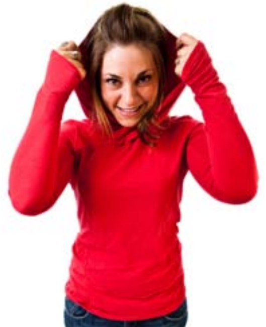
#125 HIDA hoodie Stretch jersey 8 oz 70% viscose bamboo, 25% organic cotton, 5% spandex XS-S-M-L-XL