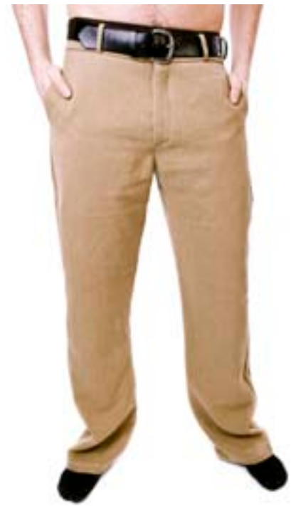
#429 CITY FALL pants Hempcel twill 9 oz 55% hemp, 45% tencel 30-32-34-36-38