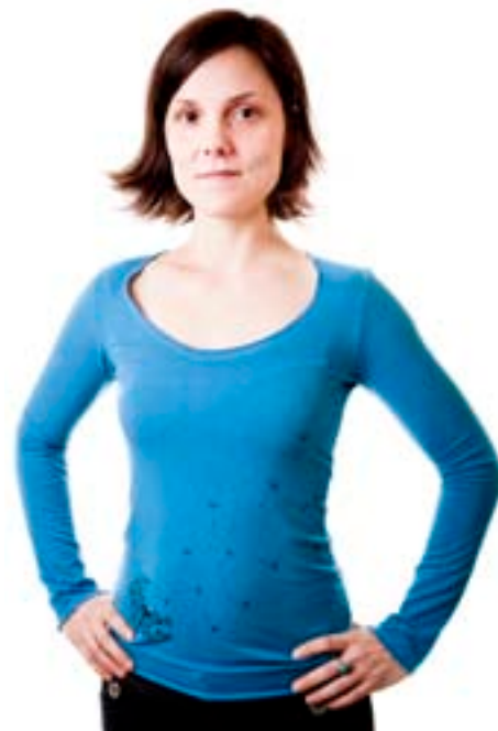
#160 JULIETTE L/S PRINT Stretch jersey 8 oz 67% viscose bamboo, 28% cotton, 5% lycra XS-S-M-L-XL