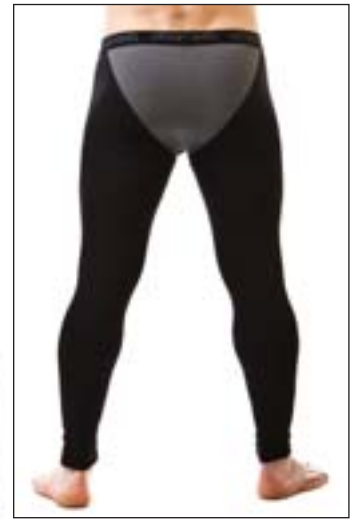
#477 FOX BAMBOO long johns Stretch jersey 8 oz 67% viscose bamboo, 28% cotton, 5% lycra S-M-L-XL-XXL