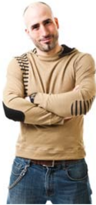
#359 STRIPEGATE hoodie Medium jersey 7 oz 55% hemp, 45% organic cotton S-M-L-XL