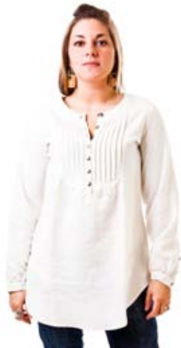
#130 KAYA Tunique Hempcell muslin 6 oz 55% hemp, 45% tencel XS-S-M-L-XL