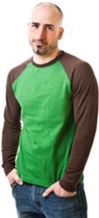
#388 EXPOS L/S Heavy jersey 9 oz 55% hemp, 45% organic cotton S-M-L-XL-XXL