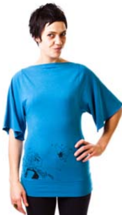
#141 CYNTHIA PRINT top Stretch jersey 8 oz 67% viscose bamboo, 28% cotton, 5% lycra XS-S-M-L-XL